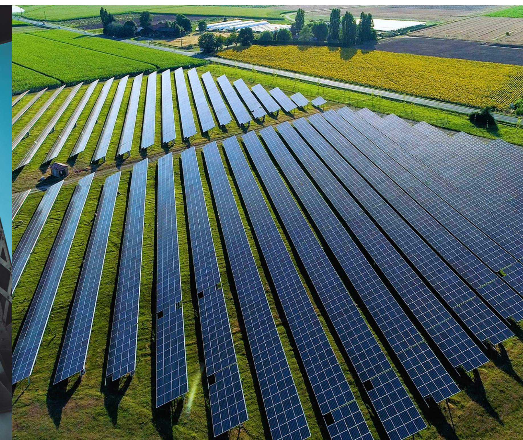
Energie- anlagen & Infrastruktur