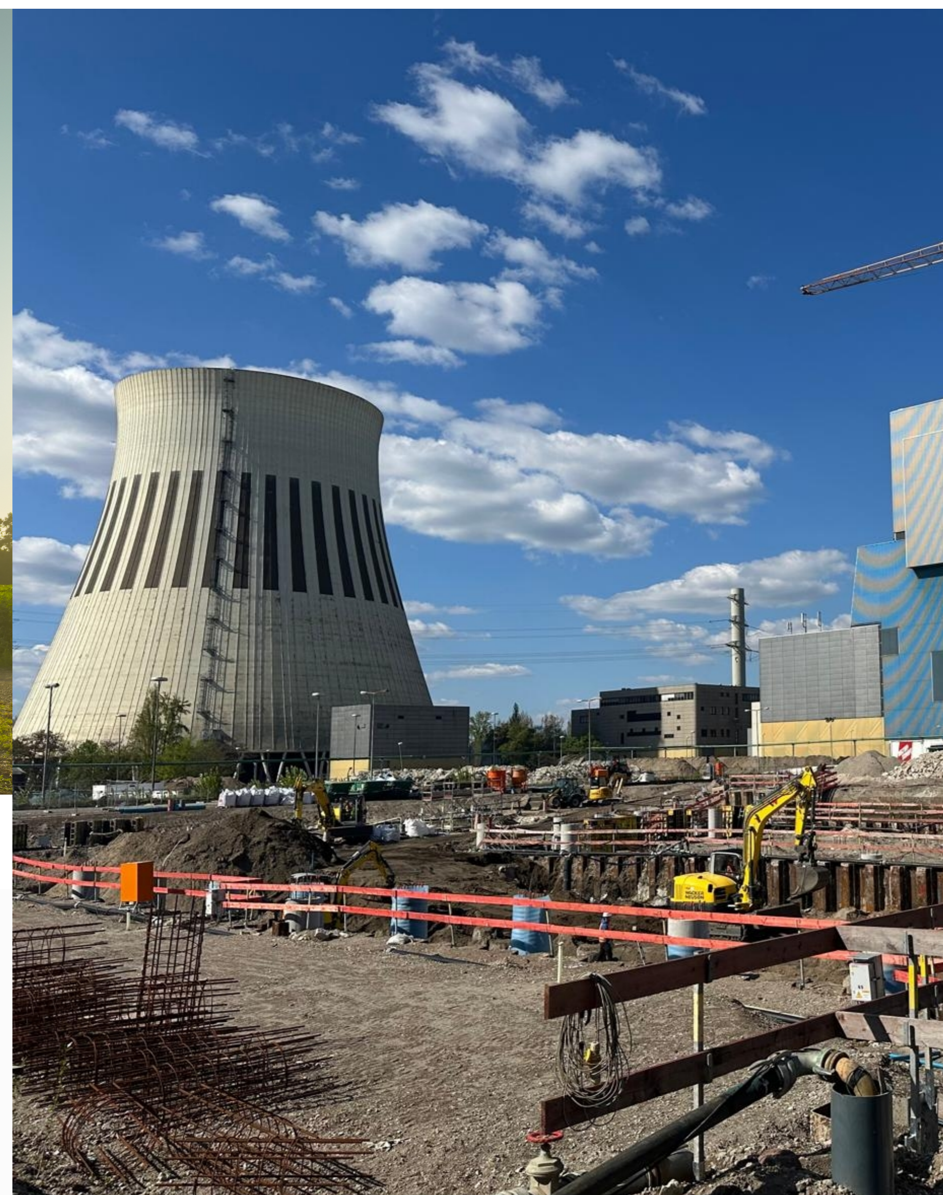
General- unternehmer & EPC