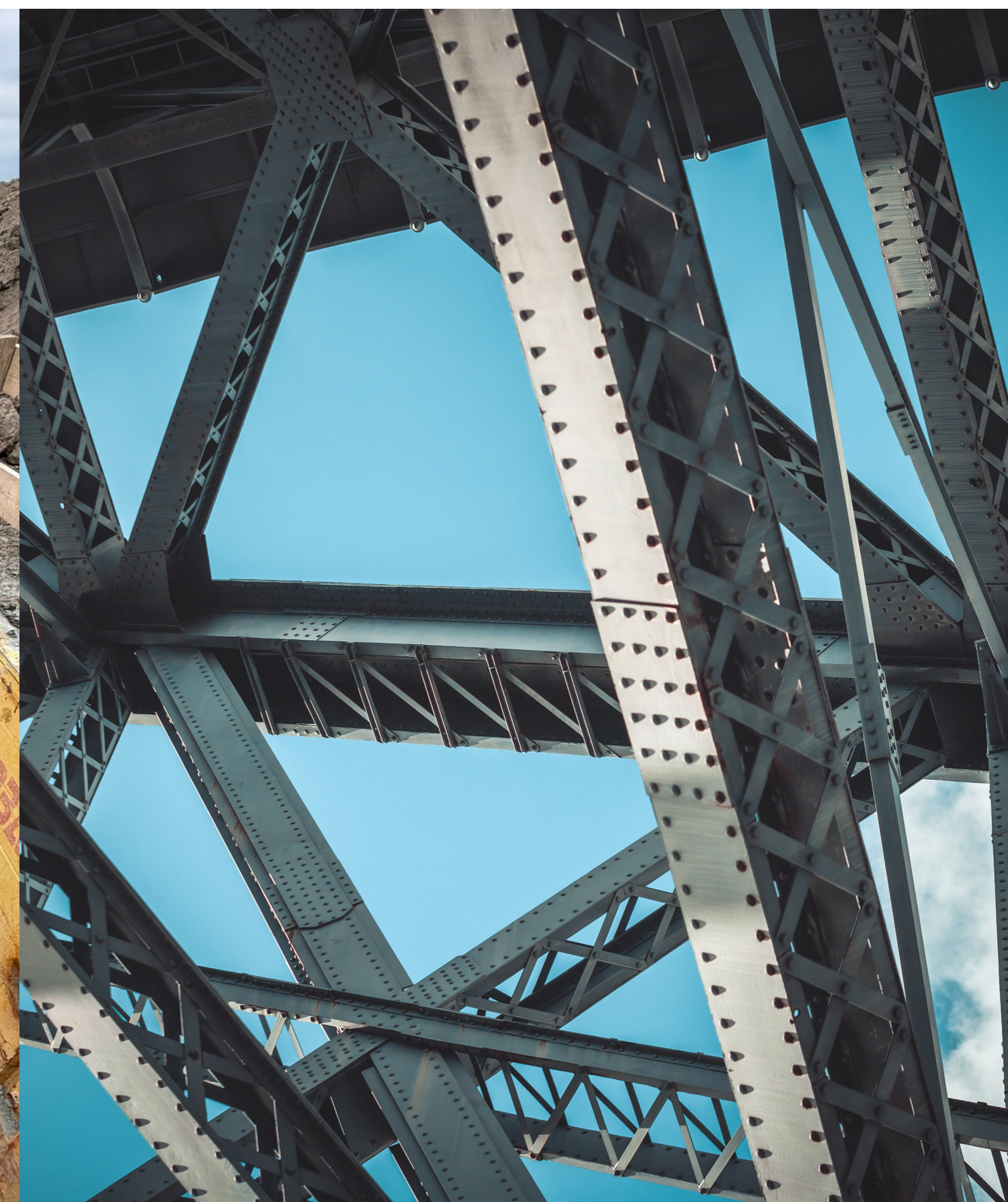
Stahlbau & Industriebau