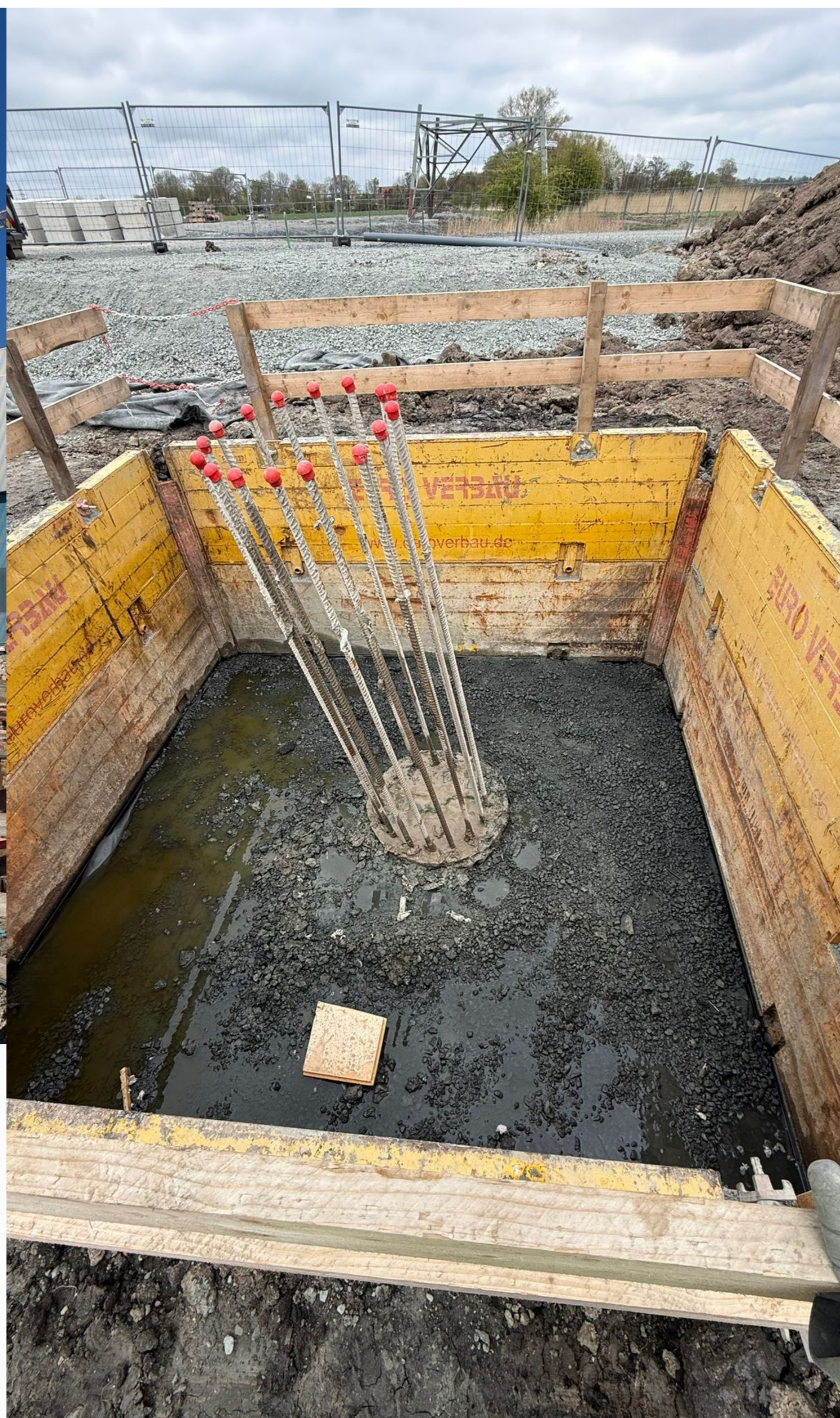
Spezialtiefbau & Fundamentbau